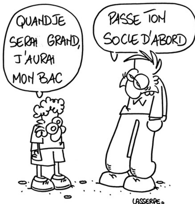
Dessin de Lasserpe pour le dossier « Quel socle commun ? » du n° 439 des Cahiers pédagogiques , janvier 2006

d'une juxtaposition d'exigences disciplinaires construites pour des élèves idéaux. Il fixe pour cela des buts d'homogénéisation culturelle pour une génération, tout en prenant en compte la nécessité de diversifier ses voies d'accès pour des élèves inégalement initiés aux codes de la culture scolaire. Il inclut donc notamment les méthodes et les outils pour apprendre qui, pour nombre d'élèves issus de milieux populaires, ne vont absolument pas de soi. Il consacre un domaine spécifique à la formation de la personne et du citoyen qui demeure un objectif fondamental. Il n'oublie pas pour autant les disciplines qui, à égalité désormais, se retrouvent dans la contribution à la maîtrise des langages pour penser et communiquer, décisifs dans les scolarités contemporaines et retrouvent, dans les domaines 4 et 5, leurs spécificités d'accès aux systèmes naturels et techniques ainsi qu'aux représentations du monde et de l'activité humaine.