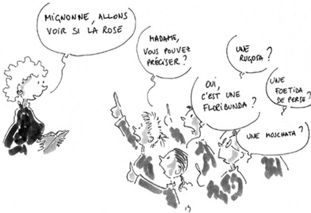
Dessin de Pol Legall

Les programmes du lycée sont, quant à eux, très précis : pour prendre deux exemples, il faut étudier en classe de 2 de , outre la poésie et des textes d'argumentation, au moins une pièce du théâtre classique et un roman réaliste et, en terminale littéraire, une solide culture est nécessaire aux élèves pour confronter Sophocle et Pasolini sur le mythe d'Œdipe ou pour mettre en perspective le roman de Gide Les Faux Monnayeurs et le journal que l'auteur a tenu durant son écriture.