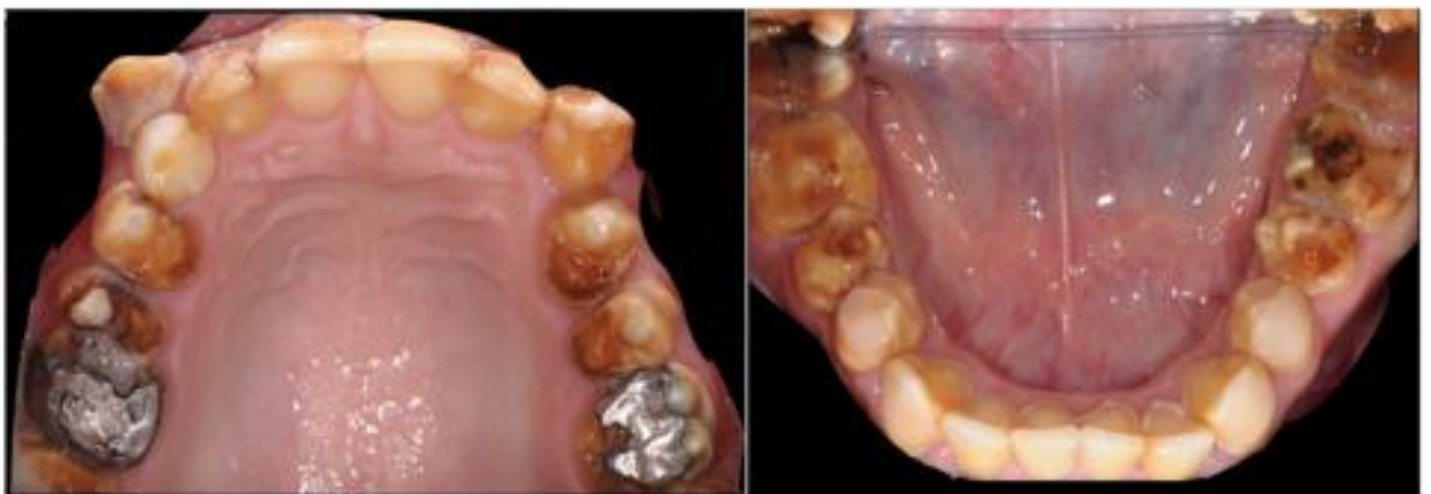
Photos 1 à 3 (photo 4 voir page suivante)